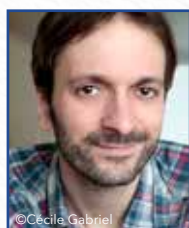
Nicolas HITORI DE S D